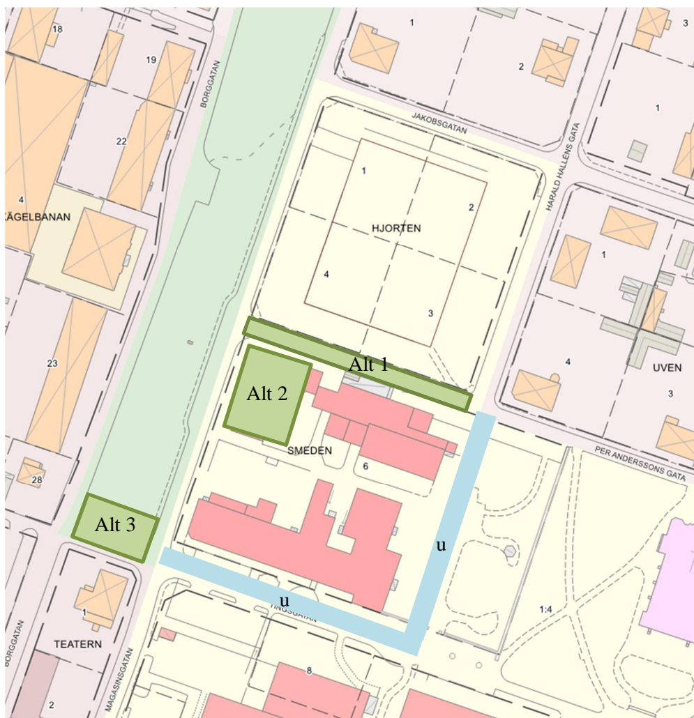
Figur 3 Alternativa placeringar dagvattenmagasin samt u-område

Förstahandsplats för dagvattenmagasin (rörmagasin) är i Per Anderssonsgata där grova dagvattenrör kan anläggas i befintlig rörschakt. Gatan kommer däremot troligen att ianspråkta för byggnationer. Alternativ två för dagvattenmagasin är i kv Smeden, nordvästra hörnet, om byggnaden rivs. Då i form av kassetmagasin. Där har det däremot visat sig finnas ett skyddsrum och byggrätt för sporthall diskuteras. Alternativ tre är i grönområdet mellan Borggatan och Magasinsgatan där möjlighet finns att anlägga kassetmagasin delvis i gatan och in på södra änden av grönområdet. Anläggandet förutsätter att några tallar får tas ned.